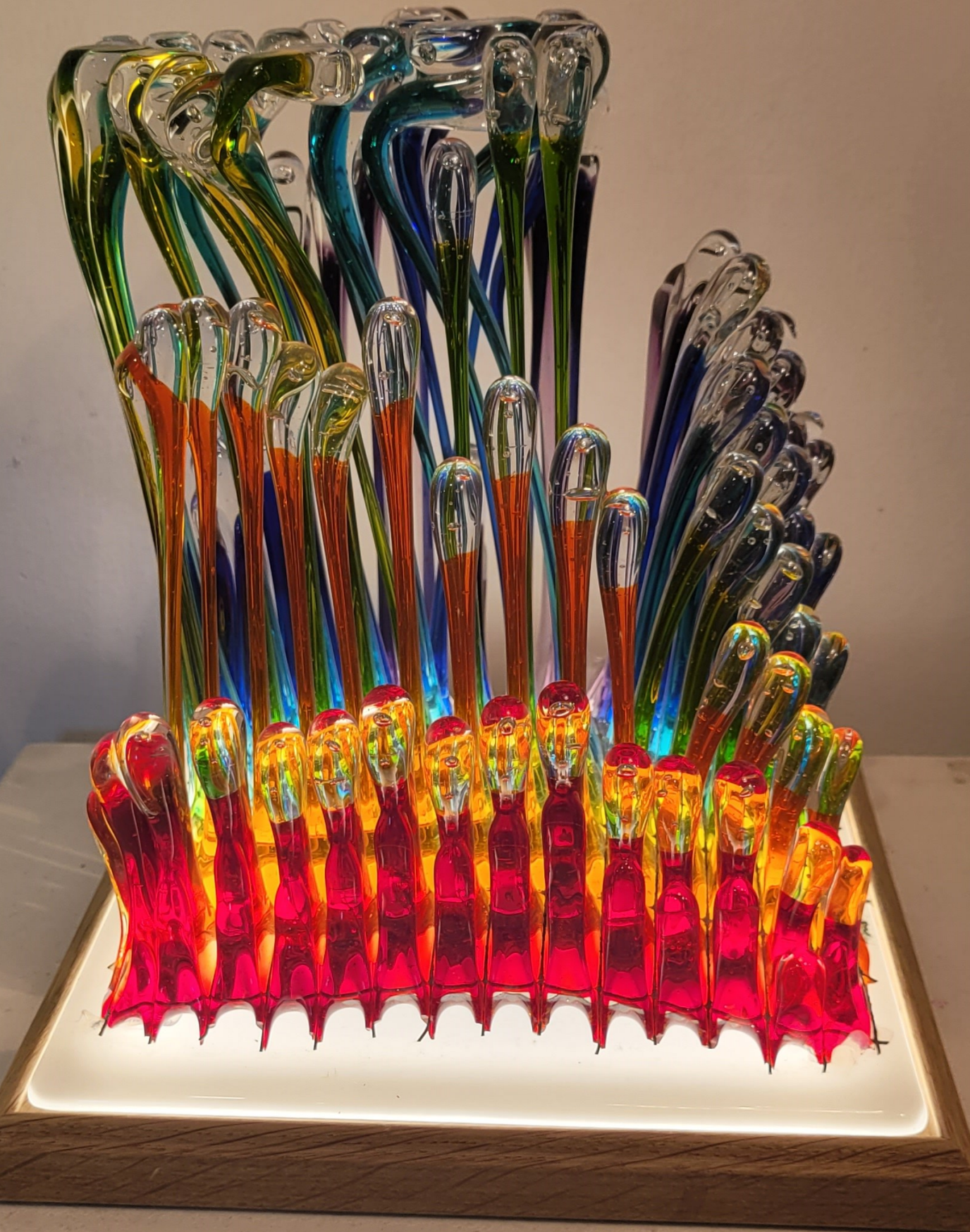
Erna Moller – Glaskunst uit Denemarken. Glassymfonie Aurora (2025), een muzikale beleving